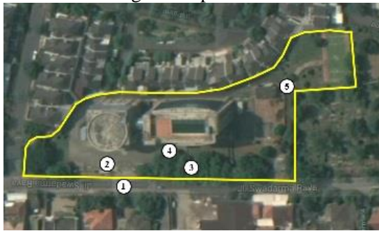
Gambar 1. Denah Universitas Tanri Abeng