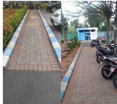
Gambar 4. Gerbang masuk ke parkir dan ke jalur pedestrian

3. Gerbang masuk ke parkir dan ke jalur pedestrian