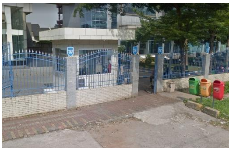
Gambar 2. Gerbang utama entrance