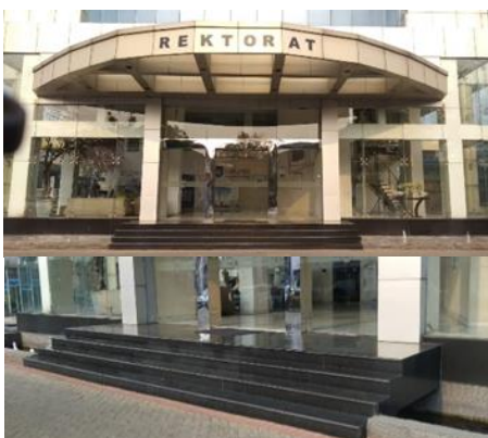
Gambar 3. Pintu masuk Gedung Rektorat

3. Gerbang masuk ke parkir dan ke jalur pedestrian