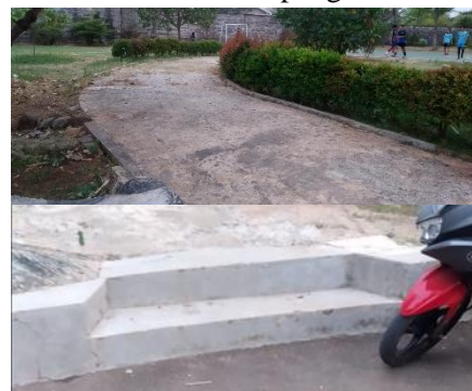
Gambar 6. Akses masuk ke lapangan futsal