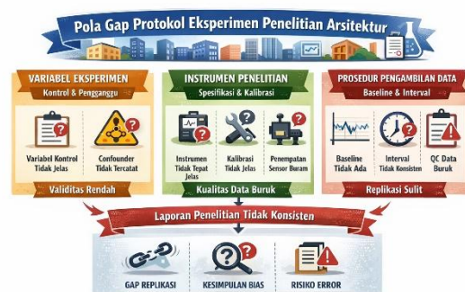
Gambar 2. Hasil dari Pola Gap Eksperimen